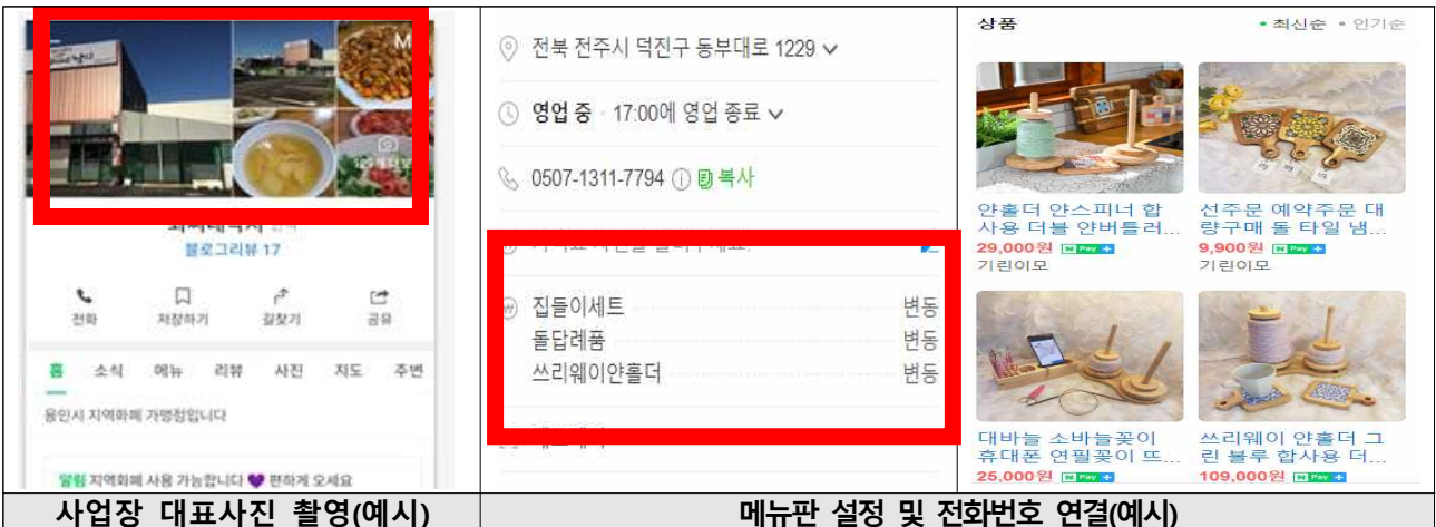
사업장 대표사진 촬영(예시)